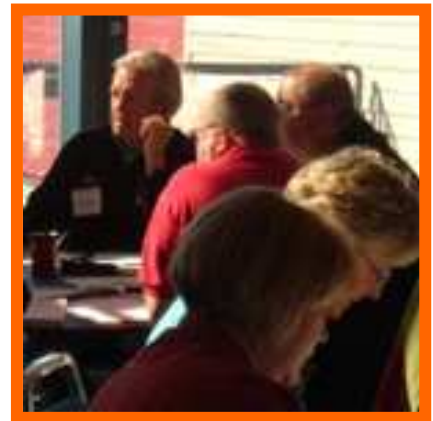
Réunion de consultation TOP à Blind River, septembre 2007

Après cinq années d'absence du district, le Sault College a mis au point un programme postsecondaire de formation préparatoire à l'exercice d'un métier dans la construction de niveau collégial qu'il offrira dans Algoma-Est en vue d'initier les élèves aux carrières de niveau d'entrée dans l'industrie florissante de la construction de résidences secondaires de la région.