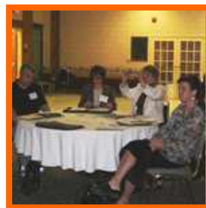
Réunion de consultation TOP à Elliot Lake, septembre 2007

Le pourcentage d'aînés dans le district d'Algoma a considérablement augmenté, passant de 16,6 % en 2001 à 19,1 % en 2006. Cette hausse se situe bien au-dessus des