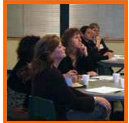
Réunion de consultation TOP à Wawa, septembre 2007

En outre, Dubreuil Forest Products a annoncé le 8 novembre 2007 qu'elle fermera complètement sa scierie à Dubreuilville jusqu'à la fin de janvier 2008, laissant ainsi 140 travailleurs sans emploi.