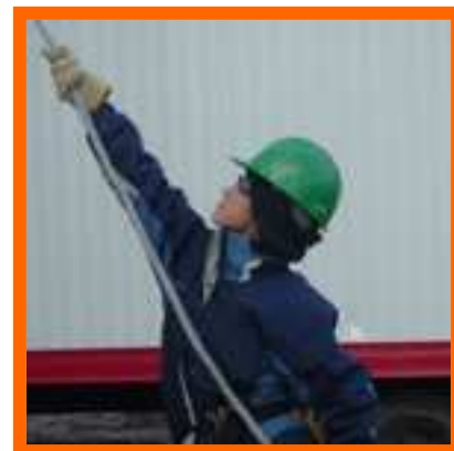
Projet de construction résidentielle auquel participent les étudiants

dans le nord-est de l'Ontario en bordure de la rive Nord du lac Supérieur et du lac Huron, le district d'Algoma, qui comporte une population de 117,460 i habitants, recouvre 48,737 kilomètres carrés, et s'étend de la rivière White au nord-ouest jusqu'à Spanish à l'est. Le district comprend les sous-districts suivants : Algoma-Nord, région de Sault Ste. Marie, Algoma-Centre et Algoma-Est. Il faut compter environ de sept à huit heures pour parcourir la distance entre Hornepayne au nord-ouest et