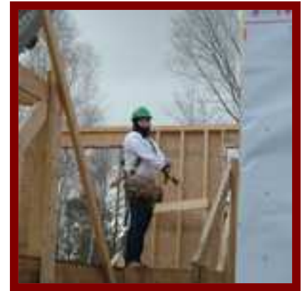
Projet de construction résidentielle auquel participent les étudiants